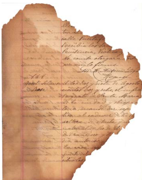
fragmento de un libro de defunciones quemado.

párrafos. Muchos de estos resúmenes no son exactos, ya que Mn. Miralles no disponía de material para poder leer documentos con tintas vegetales difuminadas o tintas ferruginosas reaccionadas.