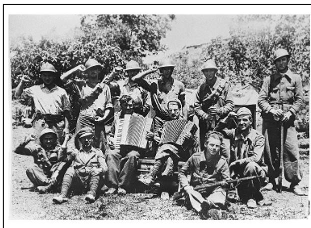
Figura 10 24

Respecto a las 3 imágenes que retratan a soldados extranjeros, localizamos dos fotografías en las que se muestra la labor de los voluntarios que defendieron la causa antifascista. Rescatamos la siguiente que fue publicada en Noticias Gráficas en dos ocasiones: el 4 de diciembre de 1937 y el 20 de septiembre de 1938 23 .