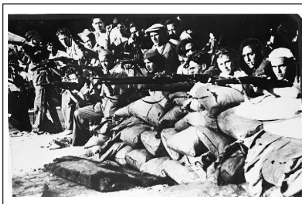
Figura 8 21

Es una imagen sellada por Noticias Gráficas , publicada en el diario el 7 de agosto de 1936 y en cuyo reverso se lee: