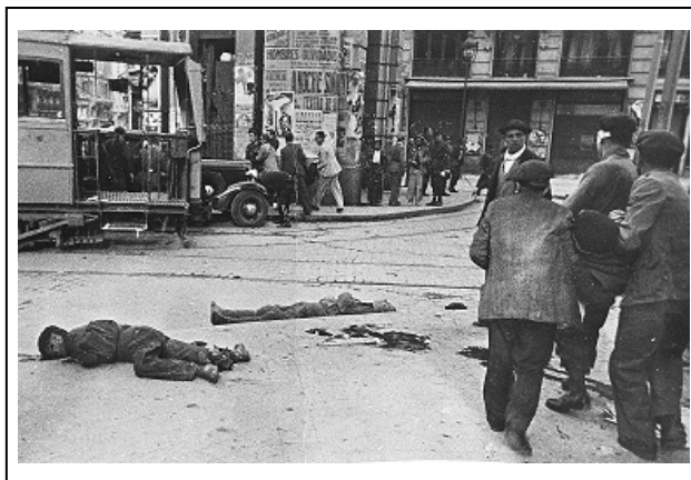
Figura 4 17

El resto de las fotografías, exactamente 39, muestran distintos aspectos de la vida cotidiana de aquellos civiles que vivieron en Madrid entre el mes de julio de 1936 y el mes de marzo de 1939. Entre este conjunto encontramos una serie de imágenes en las que se muestran las consecuencias directas de la guerra. En 2 fotografías se retrata el cuerpo inerte de varias víctimas que han fallecido como consecuencia de un bombardeo aéreo. Como ejemplo rescatamos esta, en la que se muestra el cadáver de dos ciudadanos frente al edificio de Telefónica.