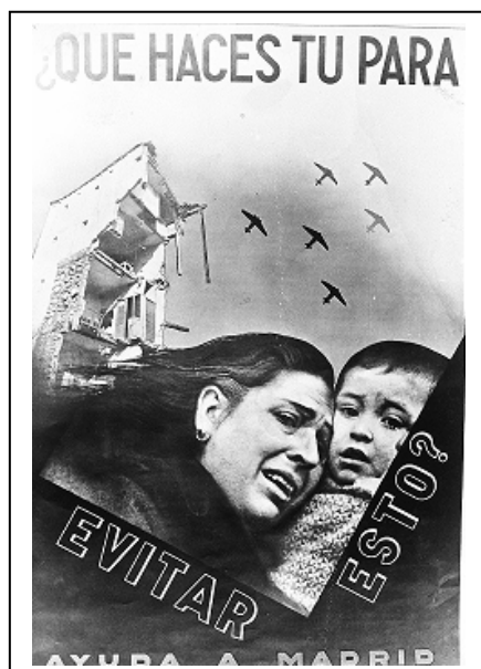
Figura 1 12

De entre el total de imágenes tomadas en la ciudad de Madrid durante la Guerra Civil Española, y que se conservan en el Archivo General de la Nación entre los fondos rescatados del diario Noticias Gráficas , 85 son fotografías y 1 imagen es un elaborado fotomontaje, en el que bajo el lema: “¿Qué haces tú para evitar esto? Ayuda a Madrid” se incita al observador a actuar ante las negativas consecuencias de los bombardeos enemigos. Para respaldar el mensaje, el autor emplea una fotografía de una mujer desgarrada que coge a su hijo en brazos.