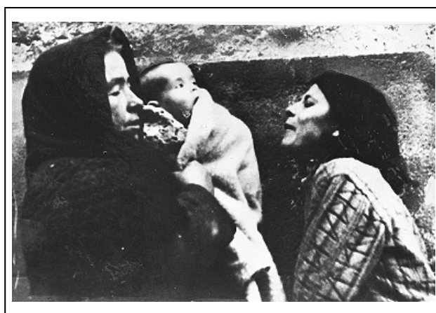
Figura 6 19

Algunas fotografías centran su atención en otras consecuencias de la guerra, como la demostración de dolor por la pérdida de un ser querido, la evacuación o el trabajo en la industria de guerra. Interesantes son las imágenes que tienen como protagonista a la mujer, concretamente 18. La mayoría, exactamente 11, muestran la imagen de mujer víctima retratada con sus hijos, en escenas de evacuación o afectadas por los bombardeos. Entre ellas rescatamos esta: se trata de una imagen en la que se fotografía a dos mujeres, de distinta generación, con un bebé, que muestran su desolación tras un bombardeo.