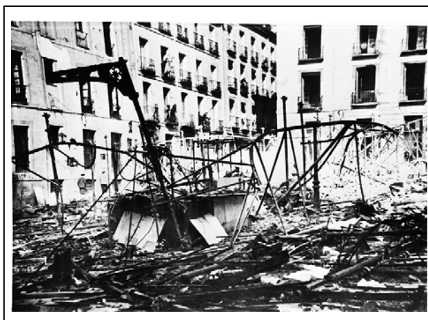
Figura 5 18

Se trata de una fotografía sellada por Associated Press Photo , que fue publicada en Noticias Gráficas el 23 de diciembre de 1936 y en cuyo reverso se lee: