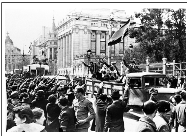
Figura 2 15