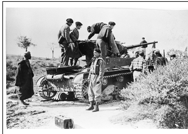
Figura 11 25

En la tercera imagen puede identificarse a un soldado del ejército moro. Se trata de una fotografía sellada por Associated Press Photo of London , tomada el 8 de noviembre de 1939 y que nunca fue publicada en el diario.