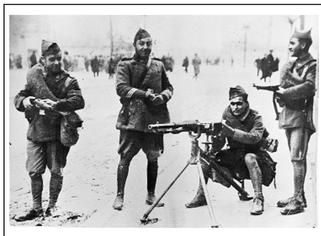
Figura 3 16

De las 47 fotografías que están tomadas en la retaguardia durante la guerra, en 8 de ellas los protagonistas de la acción son los milicianos o militares que desempeñaron distintas funciones en la ciudad, como en esta escena, en la que se muestra un grupo de cuatro milicianos armados que montan guardia en una calle de Madrid.