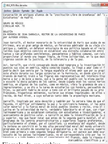
Ejemplo de un archivo

La metodología de digitalización se refiere a cuestiones técnicas. El escaneado se ha llevado a cabo con una resolución de 400 ppp, creando archivos imágenes en tiff , que serán la copia de conservación permanente. A partir de estos archivos, se trabajarán los otros formatos de salida con sus diversas funciones: jpg para imágenes de visualización individual en web, archivos en formato pdf multipágina para el estudio de los boletines completos, archivos en formato txt para la recuperación de texto en formato universalmente accesible y ficheros doc para la edición de ese texto.