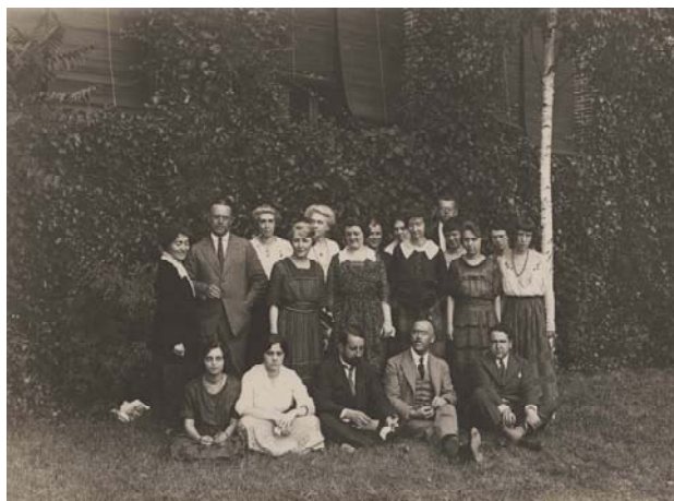
Fig. 3. Curso de verano de 1921 en los jardines de la Residencia de Estudiantes. En primera fila, sentados, Tomás Navarro Tomás y Américo Castro.

Por otra parte, la propia existencia de estos fondos, plantea diversos problemas jurídicos a la institución. En nuestro caso, son pocos los que han sido regularmente depositados por sus propietarios o por sus herederos, pero también es muy complicado y a veces imposible, localizar a sus propietarios.