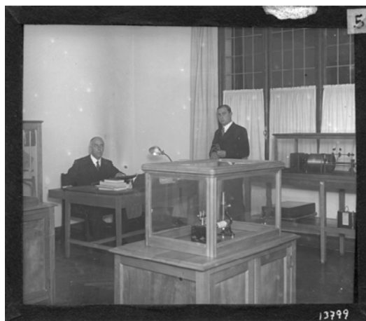
Fig. 4. Laboratorio de Fonética del Centro de Estudios Históricos. Tomás Navarro Tomás, sentado, junto a uno de sus colaboradores.

El Archivo de la Palabra dirigido por Tomás Navarro Tomás, fue creado en 1930 como una nueva línea de trabajo de la sección de Filología del Centro de Estudios Históricos (1910-1939), destinada a reunir los materiales sonoros que proporcionan información sobre lenguaje y música popular, especialmente relativos a la cultura hispánica. Las dos personas encargadas directamente del Archivo de la Palabra y de las Canciones Populares fueron el experto en fonética Tomás Navarro Tomás y el folklorista asturiano Eduardo Martínez Torner.