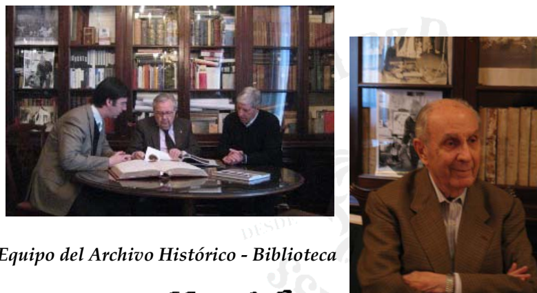
Equipo del Archivo Histórico - Biblioteca