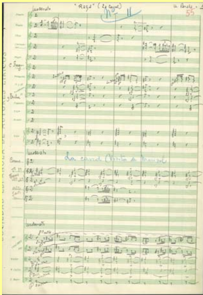
Primera página de la partitura autógrafa de Raza