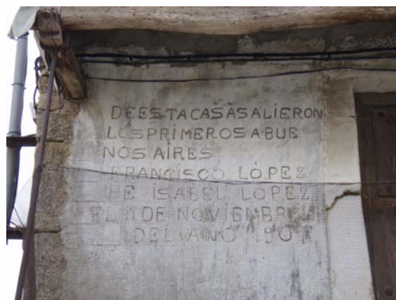
Escritura de emigrantes. La Vidola (Salamanca).