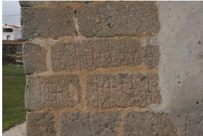
Ortigosa del Río Almar (Ávila).